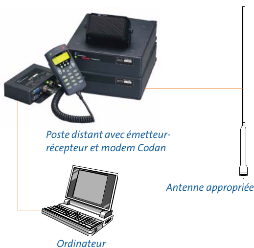
Poste distant avec émetteur-récepteur et modem Codan