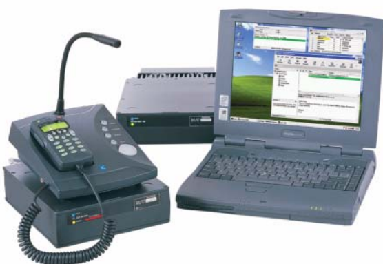
Logiciel Email pour HF UUPlus avec l'équipement HF Codan

La sélection de canaux est automatisée en pré-configurant jusqu'à 5 canaux dans le logiciel UUPlus, ou en utilisant la fonctionnalité Gestion automatique de liaison (CALM) Codan de l'émetteur-récepteur.